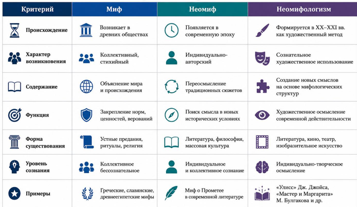
Таблица 1. Сравнительная характеристика понятий «миф», «неомиф» и «неомифологизм»

Анализ научной литературы показывает, что наиболее сложной стадией развития мифологических структур является неомифологизм , который представляет собой особый художественный и культурный метод. Его сущность заключается не в простом воспроизведении древних мифологических сюжетов, а в их переосмыслении, реконструкции и создании новых символических систем. По мнению Е.М. Мелетинского , современное искусство и литература используют миф как универсальный инструмент выражения философских, психологических и социальных проблем человека [Мелетинский, 1976].